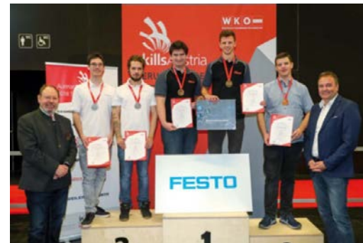
Staatsmeisterschaften der Berufe